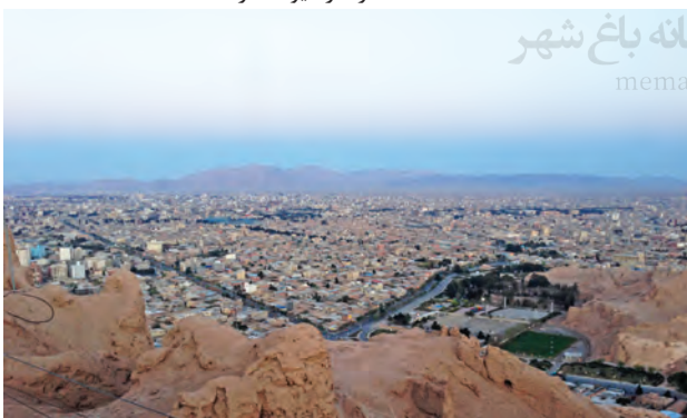
■ قلعه اردشیر (آرشیو شماره ۴)

از این میراث به شکلی مادی و عینی و بخشی دیگر هویتی معنوی و غیرمادی هستند که بودشان، هویت‌بخش وجود ایران خواهد بود. در این میان چه خبری بهتر از اینکه در گوشه‌ای از خاک ایران، بخشی از شناسنامه تاریخی ما، از زیر غبار بی‌توجهی بیرون کشیده شده و دست مهر بر سر و رویش کشیده می‌شود. بنایی که از دالان‌های تاریک تاریخ، بازتاب صدای مردمانی سخت‌کوش و پرتلاش بوده است که در دل کویر، آبادی و آبادانی را به میراث نهاده‌اند.