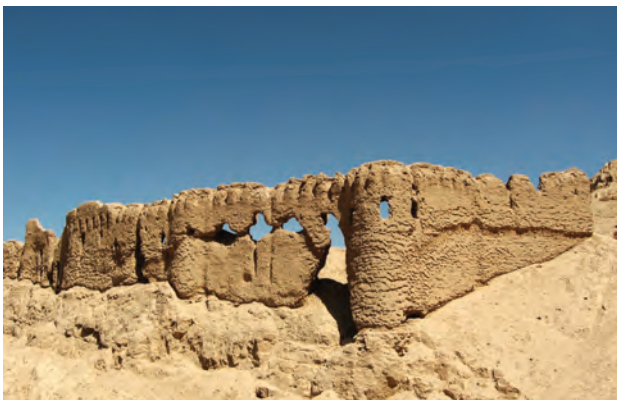
■ قلعه دختر (آرشیو شماره ۴)