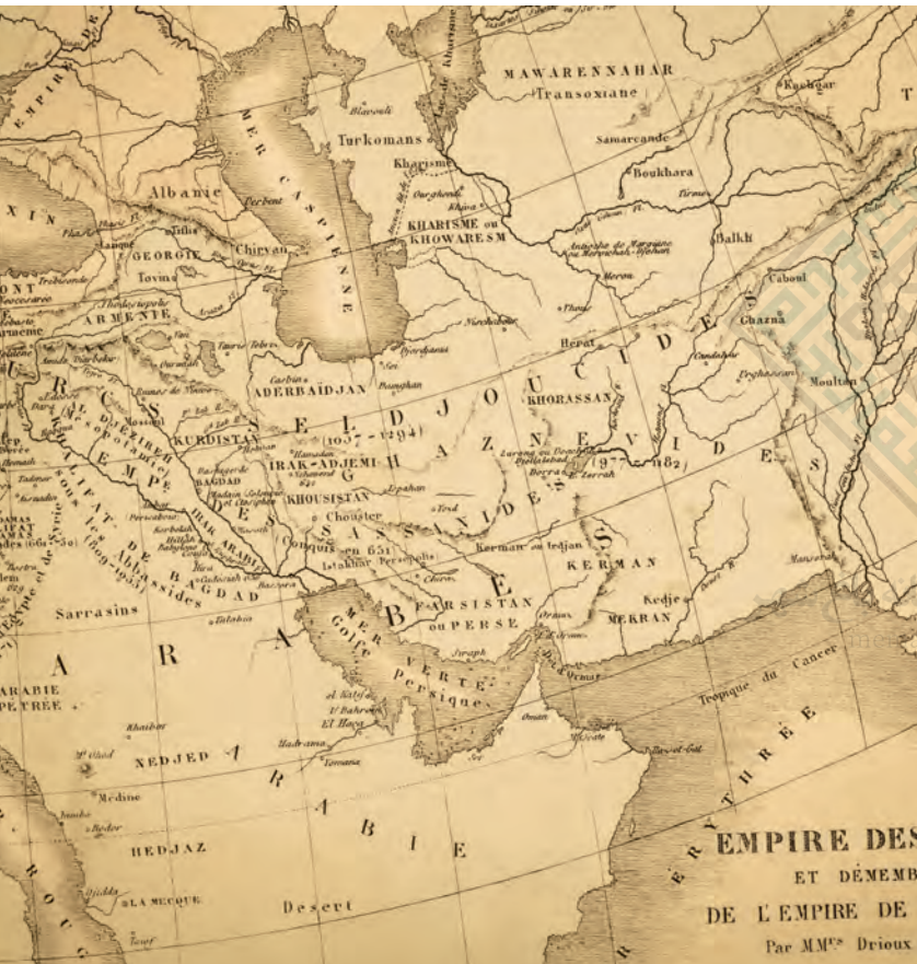
■ حدود سرزمینی ایران (آرشیو شماره ۴)

ایران، سرزمینی است به مراتب بزرگتر و وسیع‌تر از محدوده جغرافیایی‌اش. حدود سرزمینی ایران زمین به لحاظ فرهنگی گستره بسیار وسیعی دارد و مایه تأسف است اگر ما به عنوان ساکنان قلب این سرزمین بزرگ، نتوانیم مردمان این گستره را حول این مرکز گرد آوریم. در راستای این گردهمایی فرهنگی واژه فرهنگ شفاهی، برگ‌برگ آفریده‌های ادبی و هنری و خشت‌خشت بناهای تاریخی ارزشی فوق تصور دارد. برای معرفی گستره فرهنگی ایران، در قدم اول باید گنجینه‌هایی را که از پیشینیان به ما رسیده و به قول حکیم بزرگ طوس، از باد و باران گزند نیافته، بیابیم. بخشی