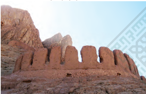
■ قلعه دختر (آرشیو شماره ۴)