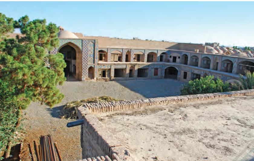
■ نمای کلی کاروانسرای وکیل (آرشیو شماره ۴)