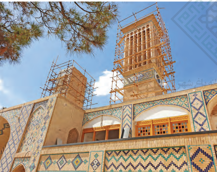
■ بادگیرهای کاروانسرای وکیل (آرشیو شماره ۴)

که ماحصل هنرمندی صدها و بلکه هزاران هنرمند گمنام یا پراوازه‌اند. مجموعه وکیل یکی از چشم‌نوازترین آنهاست که در مرکز شهر می‌درخشد و دلبری می‌کند.