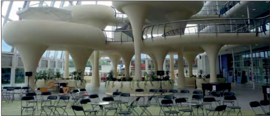
ساو تند (Southend)، انگلستان: دکوراسیون داخلی یک مدرسه که منجر به پیشرفت‌های چشمگیری در دستاوردهای دانش‌آموزان شده است.