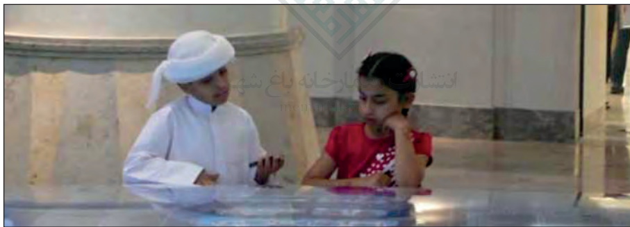
خلیج فارس (Persian Gulf): دو کودک در حال مطالعه گزینه های پیشنهادی طراحی هستند